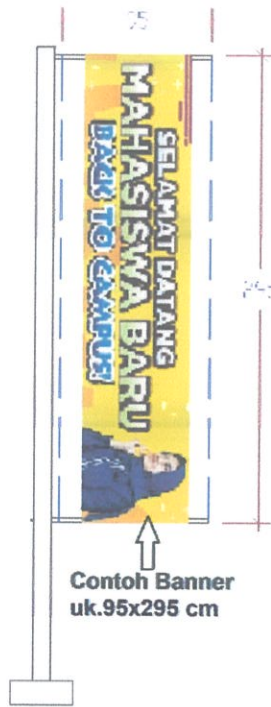
Contoh Banner uk.95x295 cm

Lampiran Surat Edaran nomor : 279/IT1.B09/TU/2023